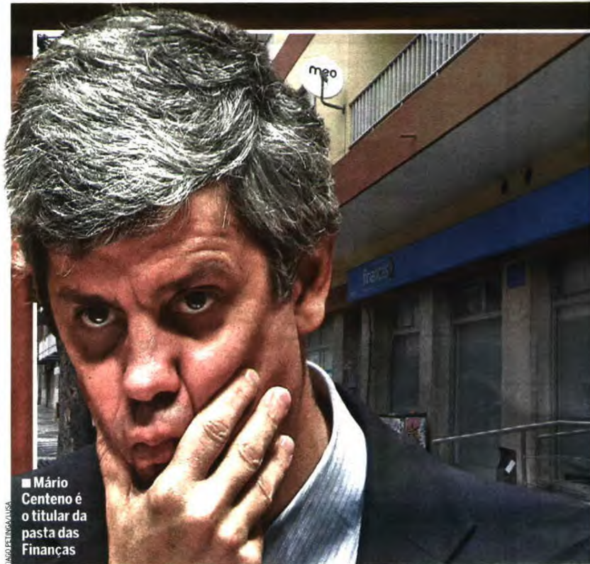
■ Mário Centeno é o titular da pasta das Finanças

■ Metade das dívidas são de empresas em falência. Há cerca de três mil milhões de euros que serão difíceis de recuperar