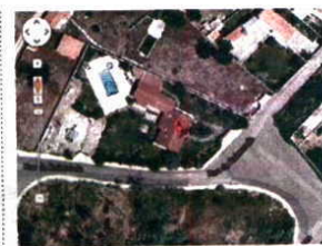
Vista do Google sobre a casa

● Em 2012, várias notícias deram conta de que os fiscais das Finanças faziam avaliações para a atualização do Imposto Municipal sobre Imóveis (IMI) através do Google e que por isso a avaliação podia ser posta em causa.