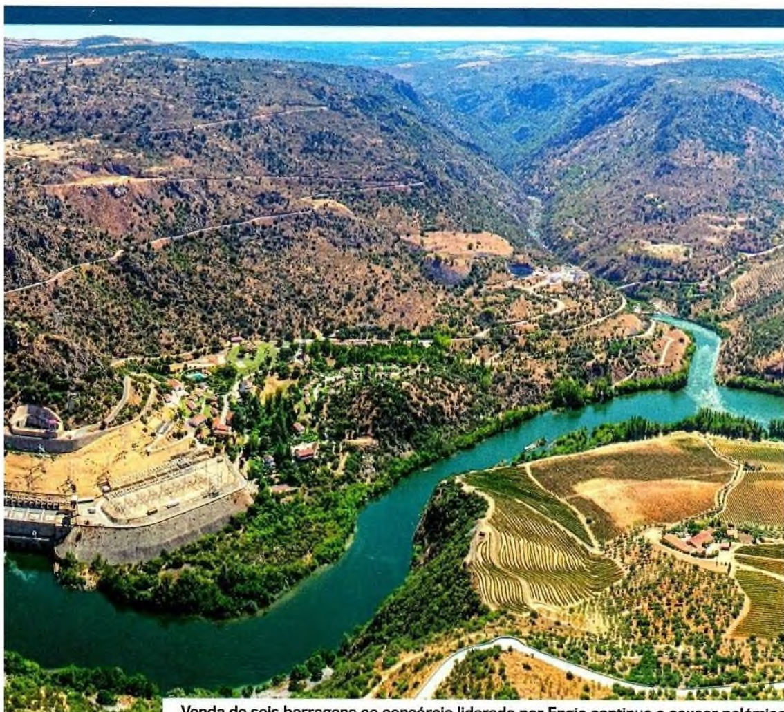
Venda de seis barragens ao consórcio liderado por Engie continua a causar polémica

condições para a realização da venda de cinco barragens na bacia do Douro e propôs que fosse solicitado parecer jurídico (parecer de 30 de julho de 2020). «Estranha-se que face ao interesse agora manifestado que [a Engie] não tenha concorrido em 2008 aos concursos internacionais, estando ciente que passando o período inicial em que vai manter alguns contratos com a EDP, que vai recorrer às várias empresas associadas à Engie, todas sediadas em França, reduzindo assim as valências locais», alertava no mesmo parecer.