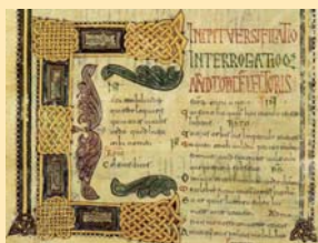
Folio con hermosa letra capital