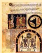
Folio del Codex Vigilanus con dibujos representando Noé con sus hijos; el mapamundi conocido entonces; y el paraíso