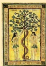
Dibujo de Adán y Eva en el Codex Vigilanus (976).