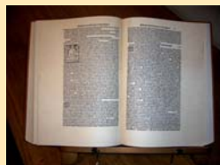
Tractatus Particularis de Computis et Scripturis, de Luca Pacioli