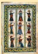
Codex Emilianensis (992), con la imagen de algunos reyes visigodos