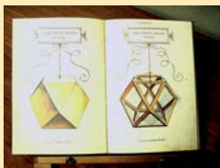
Facsímil del manuscrito De Divina Proportione, mostrando figuras dibujadas por Leonardo da Vinci