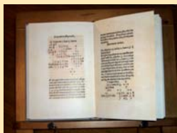
Folios del facsímil del manuscrito De Divina Proportione